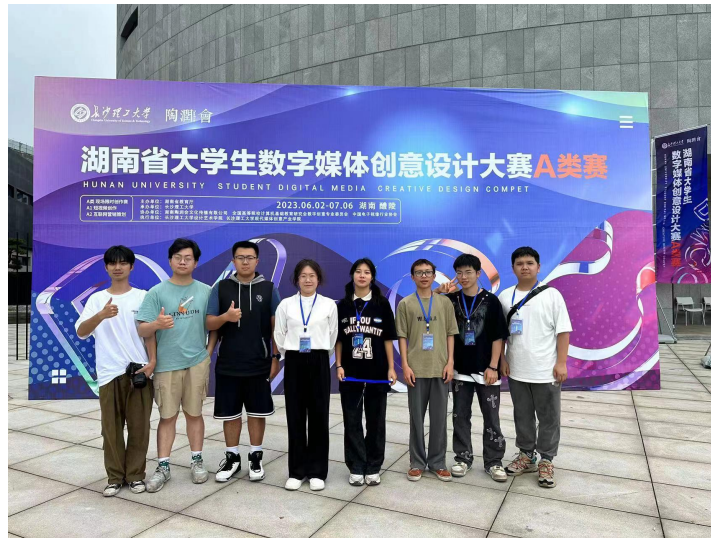
图 6 以学科竞赛驱动教学改革

3.以学科竞赛驱动教学。积极组织学生参与“全国大学生广告艺术大赛”“湖南省大学生数字媒体创意设计大赛”（图 6）等赛事，以赛促学、以赛促教、以赛促融。