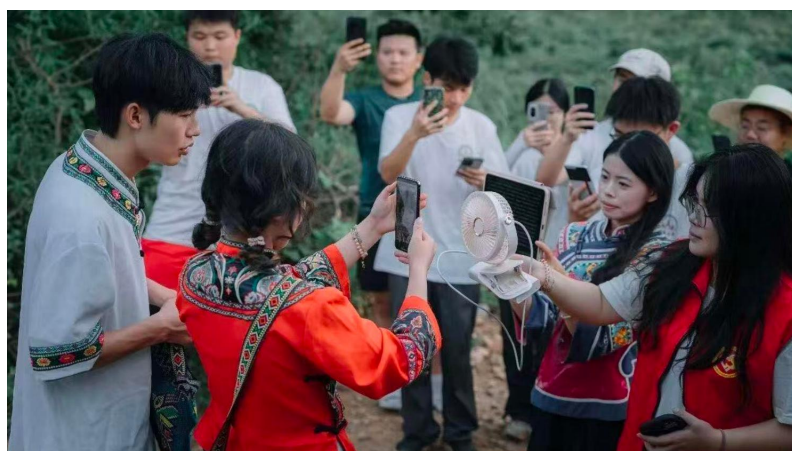
图 3 课程中组织地方文化资源收集

项目组深入湘西北地区，通过田野调查、访谈传承人、查阅地方志等方式，系统挖掘湖湘文化和常德本土文化资源，包括桃源木雕、桃源刺绣、常德丝弦等非遗文化，常德红色革命历史等红色文化，湘西北传统服饰、民间工艺等民俗文化。围绕“六大主题”教学法，建设了包含 30 余个教学案例的案例库，将地方文化资源转化为教学案例。图 3 为教学过程中收集文化资源案例。