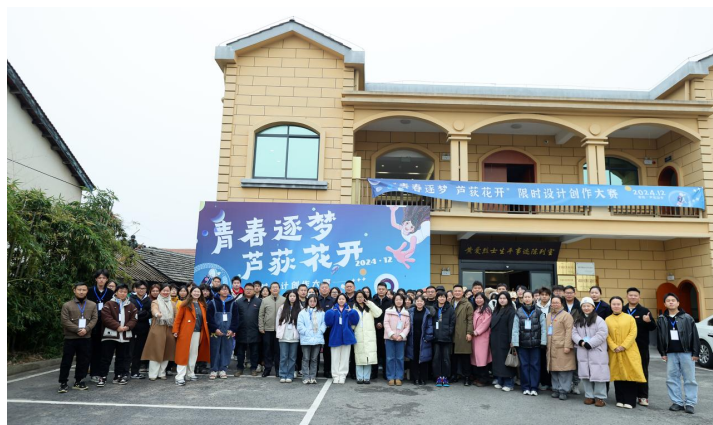
图5 “青春逐梦，芦荻生花”短视频创作大赛

2.组织主题实践活动。2023年12月，在谢家铺乡举办“青春作答·强国有我”短视频创作大赛；2024年12月，以服务芦荻山乡地方经济发展为主题，举办“青春逐梦，芦荻生花”短视频创作大赛（图5）。