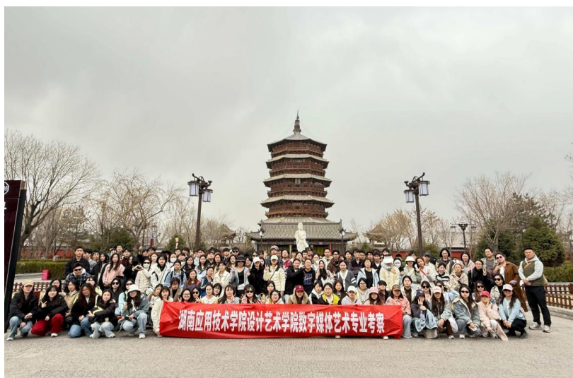
图 2 《专业考察》课程文化自信培育过程